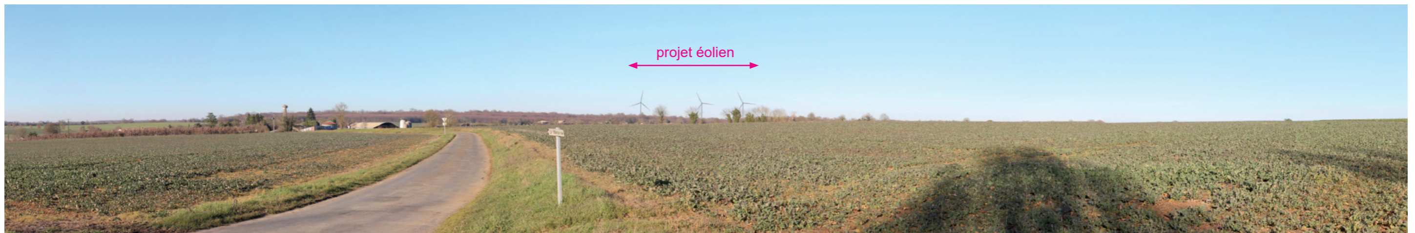
Photographie 120 : Vue sur le projet éolien depuis le sud du hameau de Chail, à proximité du tracé de la D948 (Vue 20 du carnet de photomontages).